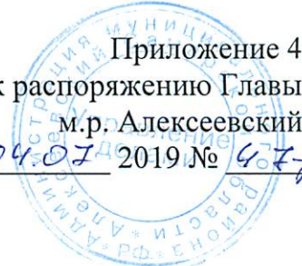
График приемки образовательных учреждений к новому 2019-2020 учебному году.