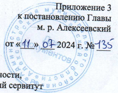
ГРАФИК проведения работ при осуществлении деятельности, для обеспечения которой устанавливается публичный сервитут

«Технологическое присоединение к сети газораспределения – Зерносушилки Р1-С 20Г, расположенной: Самарская область, Алексеевский район, с. Патровка. Газопровод высокого давления 2 кат. от существующего d=159 мм., проложенного к с. Гавриловка в восточной части кадастрового квартала 63:11:1301003 до границы з.у. 63:11:1301003:99»